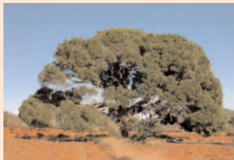
Pi ver ( Pinus pinea )