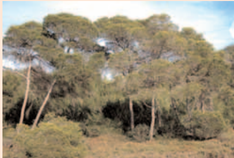
Pi blanc ( Pinus halepensis )