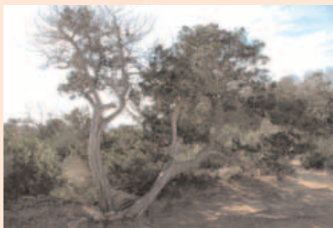
Savina ( Juniperus phoenicea )