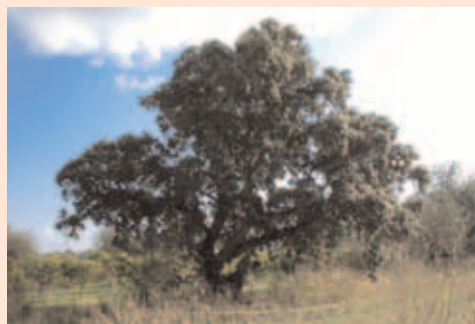
Alzina ( Quercus ilex )